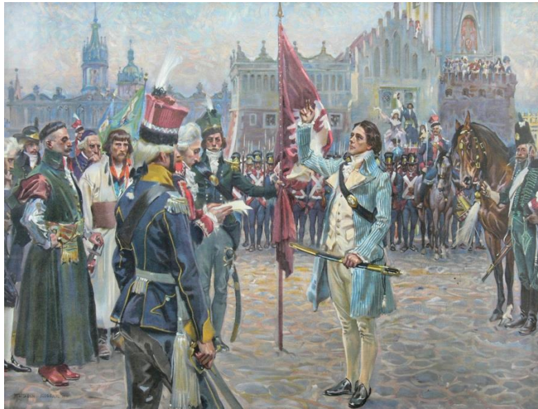
Przysięga Tadeusza Kościuszki 24 marca 1794 roku na rynku w Krakowie, obraz Wojciecha Kossaka z 1911 roku