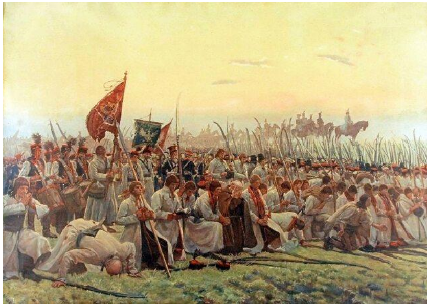
Kosynierzy pod Raławicami, obraz Józefa Chełmońskiego