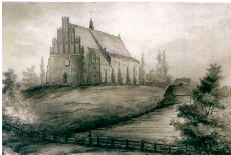
Kościół w Wiźnie, rycina z XVII wieku