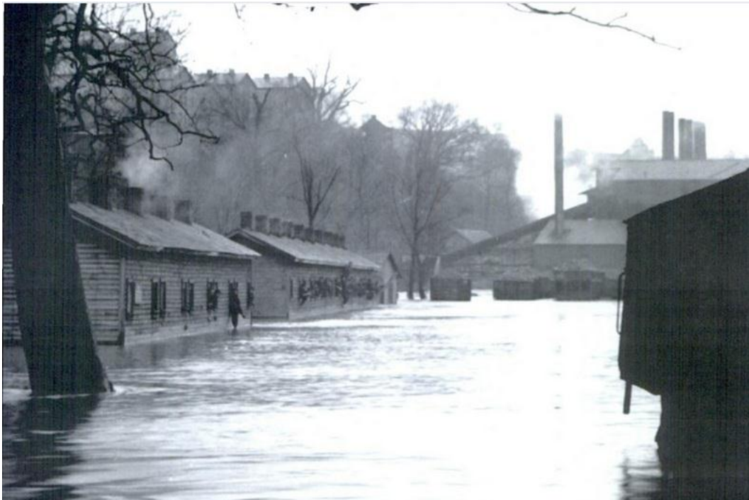
Zalana podczas powodzi kopalnia Hazel, 1912, Źródło: Jerry Grefenstette, Canonsburg, 2009, s. 46.

Źródło: https://commons.wikimedia.org/wiki/File:Map_of_Canonsburg_1897.jpg , Dostęp: 11.01.2020