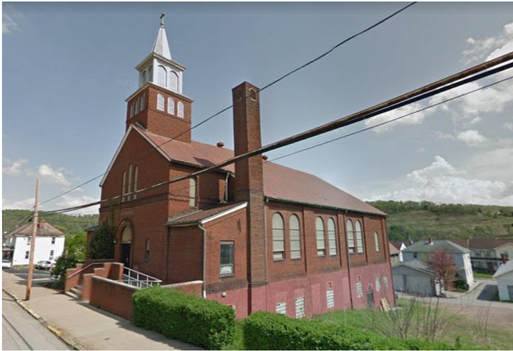
Kościół pw. Św. Genowefy w Canonsburgu, fot. współczesna, Źródło: googlemaps.com.