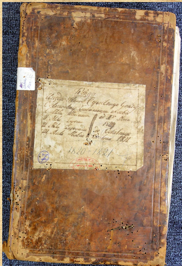
Fot. Ostrowska księga metrykalna z lat 1980–1821 i Duplikat z 1845 roku